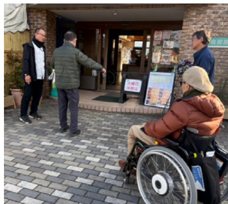
車イス利用者や建築の専門家が視察を行い、改善点等を提案している「バリアフリーアドバイザー派遣事業」 ＝鳥居原ふれあいの館（相模原市緑区）

各施設とも、一級建築士と車いす利用のアドバイザーがチームとなり半日程度の現地調査を実施。建築士による専門的立場からの助言に加え、車いす利用の当事者のからの視点も考慮