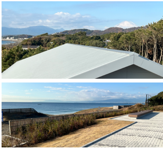
表情豊かな眺望に巡り合える癒しのスペース

水と緑が織り成す自然景観に加え、水流の音やきらめく水面が癒しと安らぎを与えてくれる身近な水辺。そんな県内の潤いあふれる親水スポットをルポして紹介します。