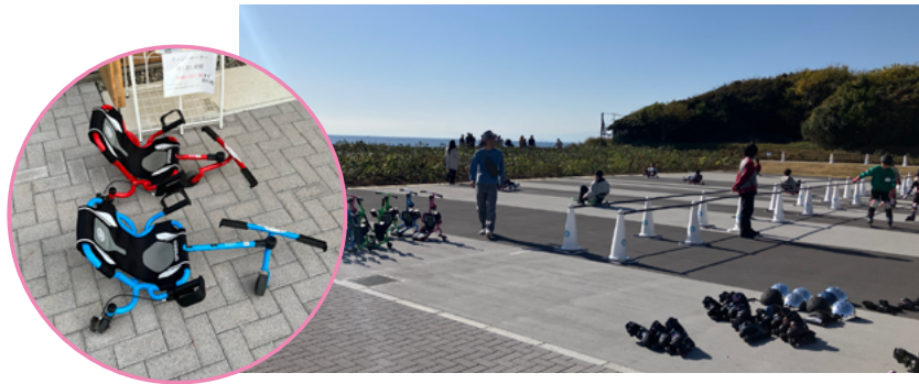
アットホームな雰囲気が感じられるイベントの様子

▶ 幼児から大人まで楽しめる「イージーローラー」。管理事務所にて25分毎、500円で借りられます