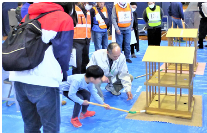
「筋かい」のない木造の家が地震に遭うとどうなるか。模型での体験等を通して、耐震化の重要性を啓発している「神奈川県震災セミナー」＝中井町立井ノ口小学校・体育館

し、改善計画を盛り込んだ報告書を依頼者に提出します。報告書では優先的に対応が求められる項目から将来的には改善が望ましい項目までを段階的に示すことで、施設にとって改修の計画を立てやすいよう配慮しています。