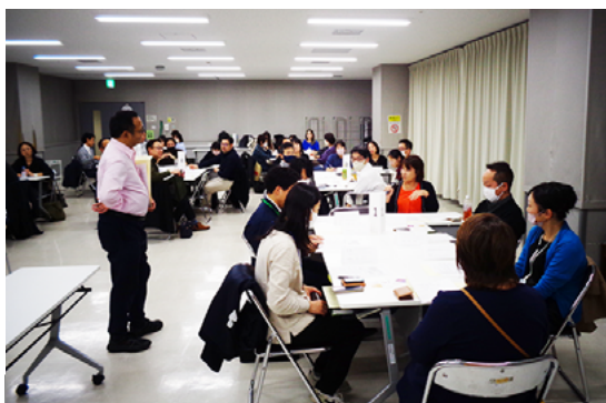
熱心な議論が繰り広げられた 4 日目のグループワーク = 2025 年 11 月 14 日

対象は、地域福祉を担うソーシャルワーカーや民生児童委員、不動産業従事者、居住支援法人・相談機関のスタッフ、地方公共団体職員など。3 日におよぶ座学では、異業種の人が「知らないことを知る、機会となるよう、さまざまな居住支援の現場で活動するエキスパートが体験談を交えつつ専門用語や慣習等について解説しました。また、居住支援を生活全般の課題と捉え、困りごとを受け止めて整理する力を習得し、課題（問題）の発見から専門部署（団体）へ寄り添いながら「つなぐ、ことができる人材を育成するため、最終日はグループワークを実施。架空の相談内容を掘り下げて隠れた情報をキャッチし、具体的な解決に結びつけるための