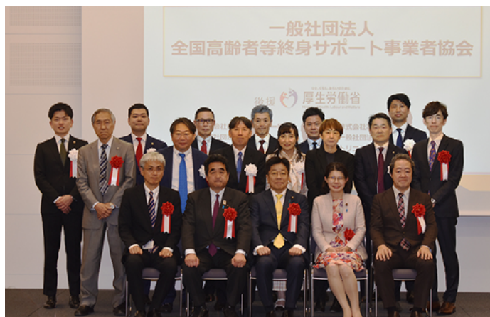
2025年11月26日に開催された一般社団法人全国高齢者等終身サポート事業者協会の設立記念フォーラムにて、幹事会社・来賓による記念撮影

近年、一人暮らしや夫婦だけになった高齢者が、古くなったり管理が大変になった持ち家を手放し、賃貸住宅に転居したいといった要望も多くなっています。頼れる身寄りがない人は緊急連絡先の確保が問題となりますが、ある不動産事業者によると、いざというとき連絡をとっても誠実に対応してもらえず、