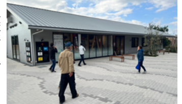
食事ができる BBQ レストラン棟④とマルシェ棟⑤

▶ 幼児から大人まで楽しめる「イージーローラー」。管理事務所にて25分毎、500円で借りられます