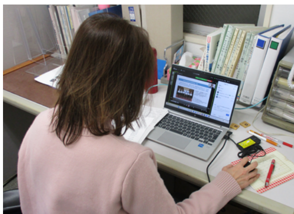
◀相談員の増員を目指して2025年度はオンライン説明会も5回開催

アップ研修も行われ、被災者の住まいの確保に係る支援体制の向上が期待されています。